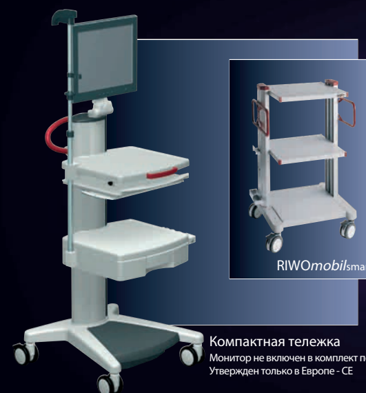
Компактная тележка Монитор не включен в комплект поставки. Утвержден только в Европе - CE

Compact Cart Trolley 32113 с выдвижным ящиком и держателями для эндоскопа, головки камеры и монитора