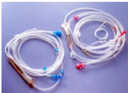
A112/V682 Universal-1 Объем заполнения - 140мл